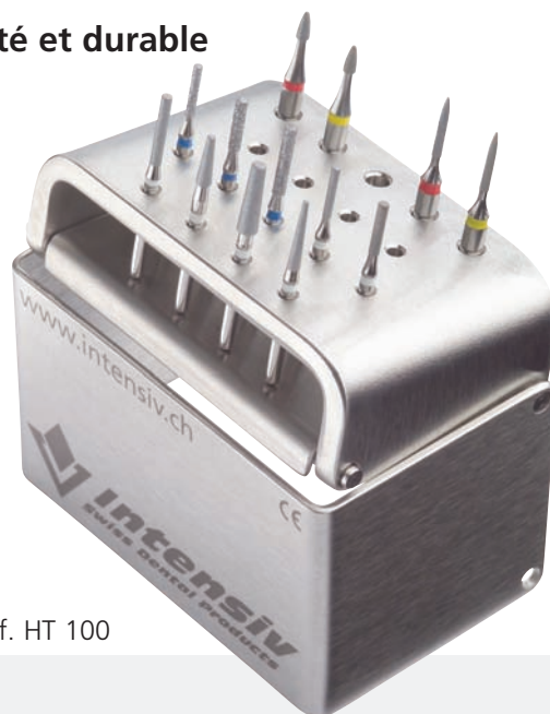
Ref. HT 100