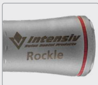
Roter Ring, 1:4