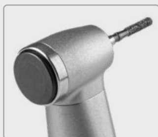
Grosser schwarzer Knopf