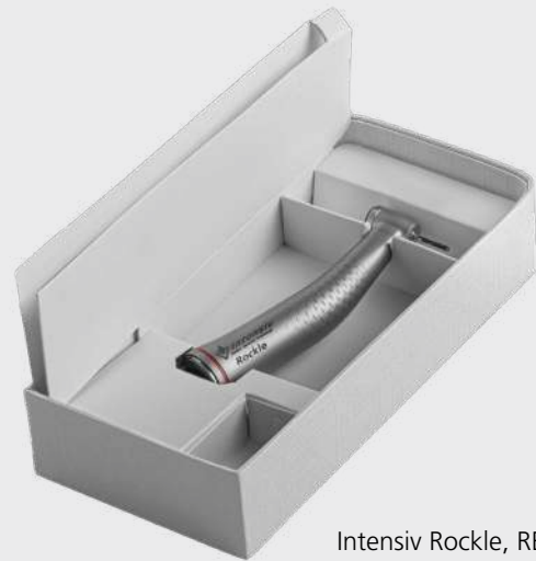
Intensiv Rockle, REF WK-900 LT