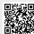
Film Intensiv Rockle Anwendung