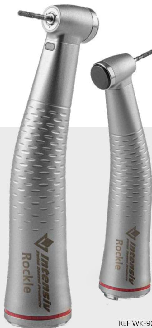
REF WK-900 LT