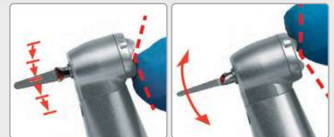
Kippschalter nach unten fixiert: oszillierende Instrumente in axial fixierter Position Kippschalter nach oben fixiert: oszillierende Instrumente axial freidrehend.