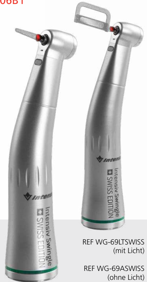
REF WG-69LTSWISS (mit Licht)

Eine effiziente Nutzung eines reziproken Winkelstückes erfordert eine Wahl zwischen der axial fixierten Position und der freien axialen Rotation der oszillierenden Instrumente während derselben Behandlung. Intensiv Swingle SWISS EDITION mit griffsicherem Design und einer kratz- und abnutzungsresistenten Glas-Beschichtung. Diese Spezialbeschichtung schützt das Winkelstück dauerhaft gegen verkratzte Oberflächen.